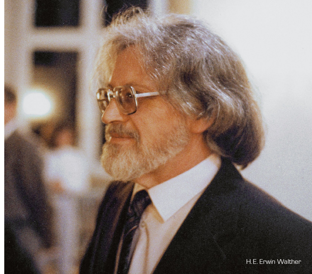
H.E. Erwin Walther